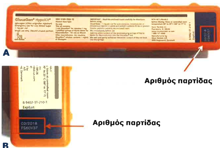
Σχήμα 1. Α) GlucaGen® HypoKit στο οποίο μπορούν να αναζητηθούν τα σημεία εμφάνισης του αριθμού παρτίδας σε κόκκινο περίγραμμα, Β) μεγέθυνση του αριθμού παρτίδας.

Ο αριθμός παρτίδας αναγράφεται επάνω στη συσκευασία του GlucaGen® HypoKit όπως υποδεικνύεται παρακάτω σε κόκκινο περίγραμμα (Σχήμα 1).